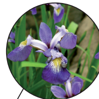
Iris versicolore Iris versicolor