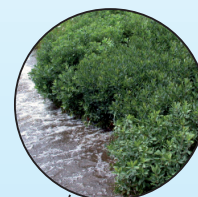
Myrique baumier Myrica gale