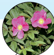
Rosier rustique Rosa rugosa

Un repère visuel pourrait vous aider lors de vos travaux. Pour plus d'information, merci de communiquer avec le CRE Mauricie